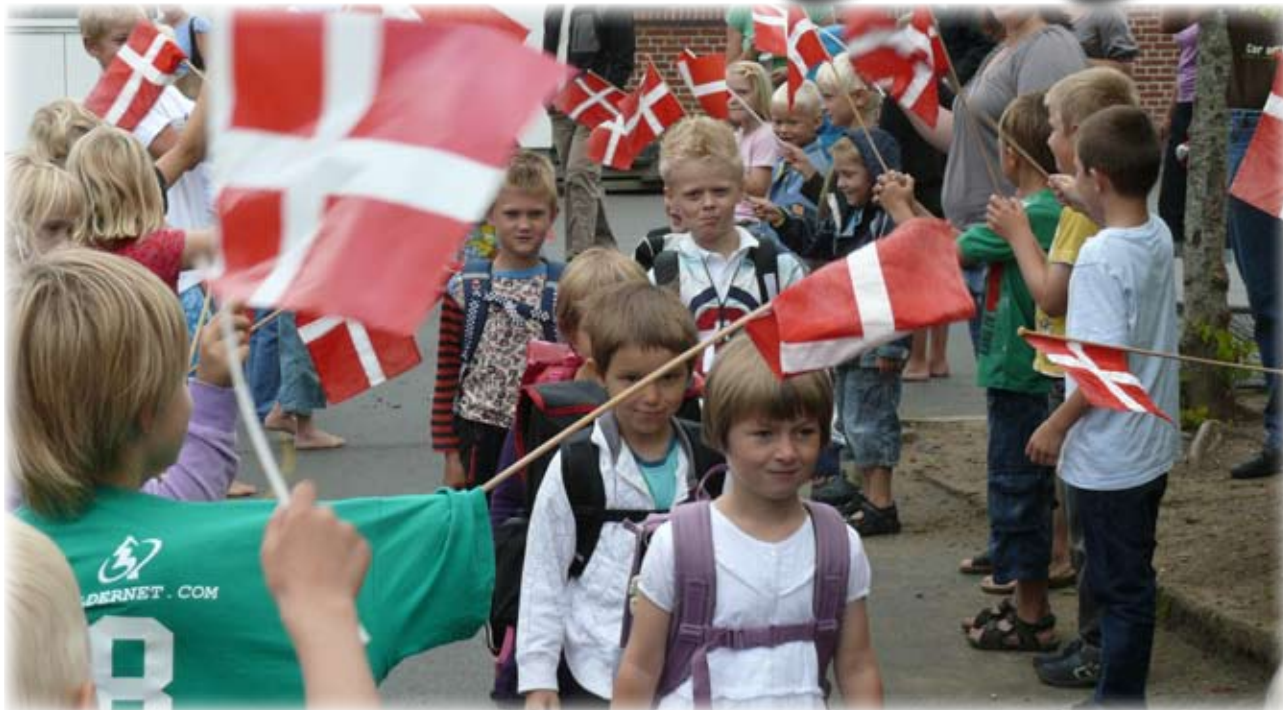
Flagallé. Første skoledag.