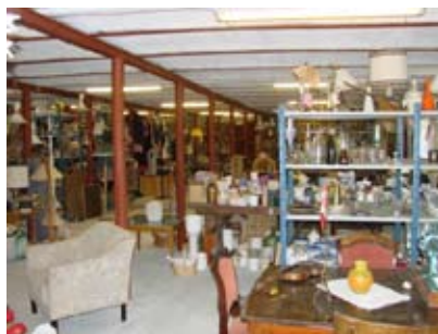
Loppeladen, hvor der afholdes loppemarked flere gange om året.

Som sagt så gjort, der blev plantet i hundredevis af træer og sat masser af løg, så haven allerede nu er smuk at se på. Haven blev indviet i 2009 under stor festivitas, kommunens borgmester plantede et ”Svindinge-”æbletræ, to andre politikere plantede også hver sit æbletræ: ”Svindinge Mark” og ”Frørup Æblet”, alle de Svindingeboere, som havde plantet træer og sat løg, så på og nød resultatet af deres arbejde.