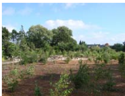
Byhaven, svindingeborgernes fælles rum.